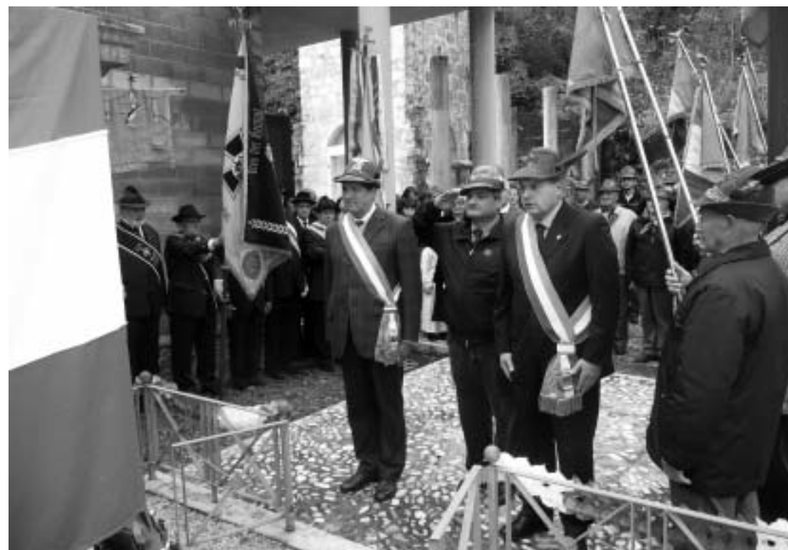
Omaggio ai caduti al monumento di Peonis

Alla cerimonia hanno preso parte assessori e consiglieri comunali, rappresentanti dei Gruppi Alpini del Gemonese, rappresentanze delle associazioni combattentistiche e d'arma di Carabinieri, marinai e fanti.