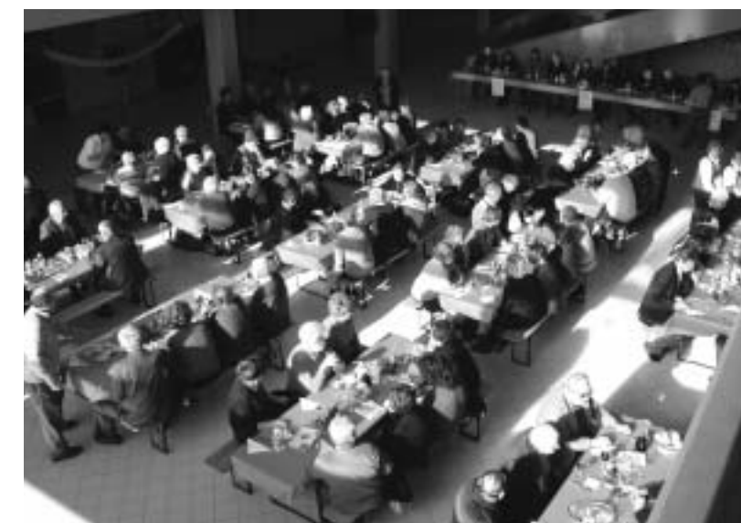
Un momento del pranzo