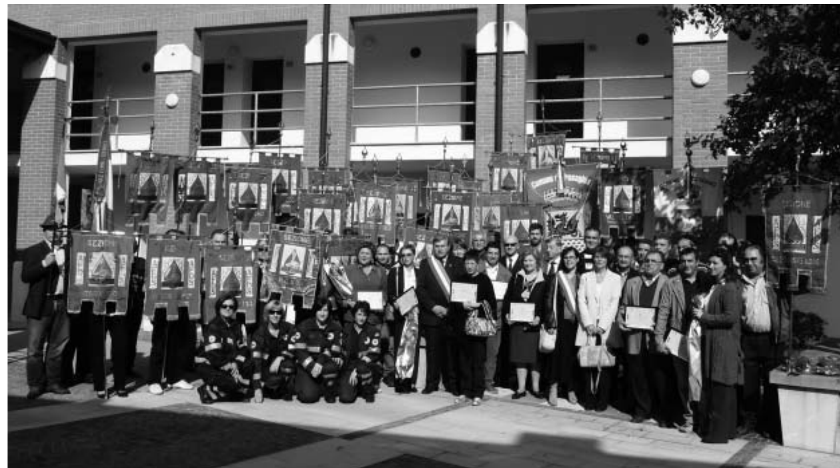
FESTA DEL DONO AD ALESSO con i labari delle sezioni

Terminate le premiazioni e gli interventi delle autorità la festa è continuata nella sala dell'ex asilo con il rinfresco preparato da volontari. Al termine il Presidente e il Consiglio direttivo hanno dato appuntamento a Bordano per la Festa del Dono 2009, quando verrà anche ricordato il trentennale di fondazione della Sezione.