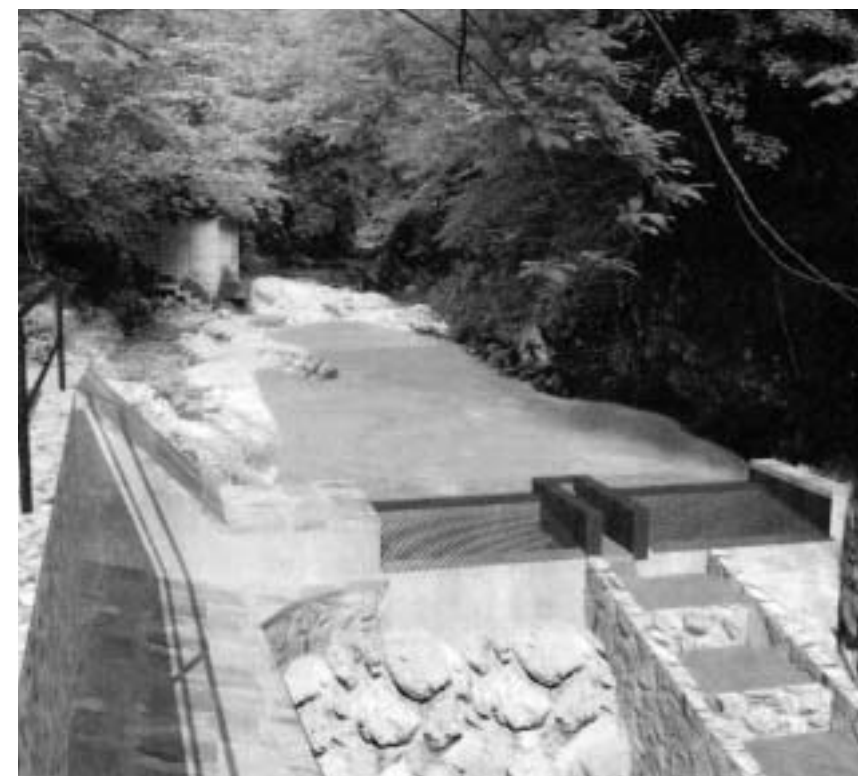
Progettazione presa idroelettrica sul Leale

Alla Regione sono state presentate due distinte domande per dare attuazione ad una derivazione idroelettrica sul torrente Leale, in località "Fontanucis", poco a valle delle opere di presa dell'acquedotto comunale. La prima richiesta risale all'aprile 2007 ed è stata avanzata dalla Ditta Renowa Srl di Brugnera (Pn) per una potenza nominale media di 1616 Kwh, la seconda nel maggio 2007 dalla Ditta Alpe Progetti di Udine per una potenza nominale media di 697 Kwh. Entrambi i progetti prevedono di collocare una presa poco a valle di quella dell'acquedotto comunale, mentre si differenziano nell'installazione degli impianti per la produzione di energia, uno adiacente al rio canale a monte dell'abitato di Avasinis e l'altro nei pressi del torrente Leale. In data 30 ottobre 2008 presso il Municipio di Trasaghis si è svolta la visita di istruttoria, convocata dalla regione, in cui le due Ditte proponenti hanno illustrato i rispettivi progetti. Sono intervenuti anche il Sindaco di Trasaghis, i rappresentanti dell'ARPA regionale e dell'Ente Tutela Pesca. Entrambe le Ditte hanno proposto una convenzione con il Comune di Trasaghis al fine di destinare una parte delle risorse sviluppate a beneficio della comunità locale. Attualmente è iniziata presso la regione Autonoma Friuli Venezia Giulia la Valutazione di Impatto Ambientale, al termine della quale sarà scelta una delle due proposte per la realizzazione dell'impianto idroelettrico.