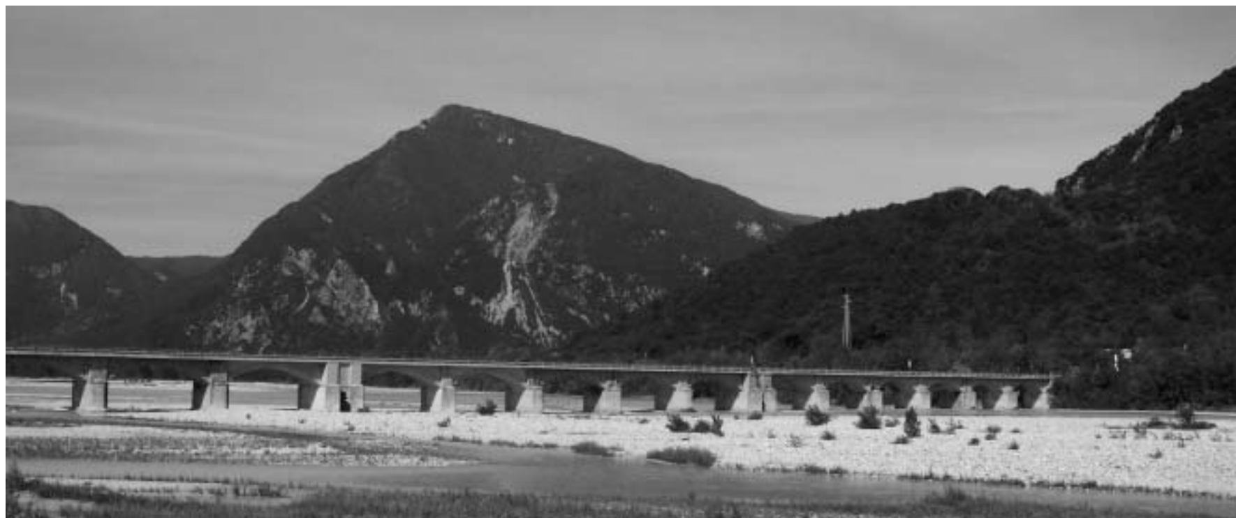
Il Puint di Braulîns e, daûr, Covria