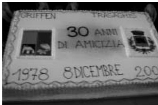
La torta del gemellaggio