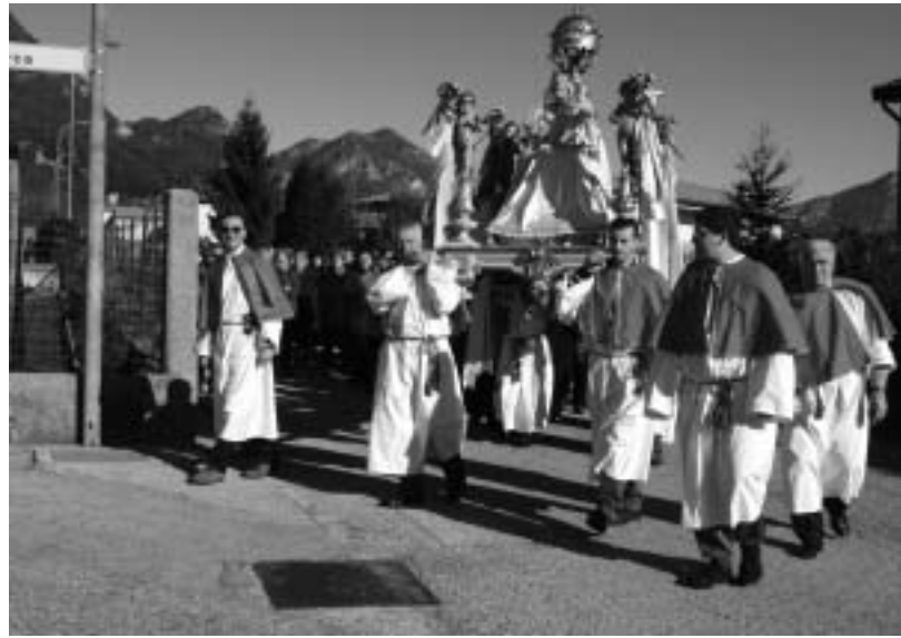
La processione della Madonna per le vie del paese

I festeggiamenti della Madonna della Salute sono stati organizzati dall'associazione "Chei di Peonis" col patrocinio del Comune