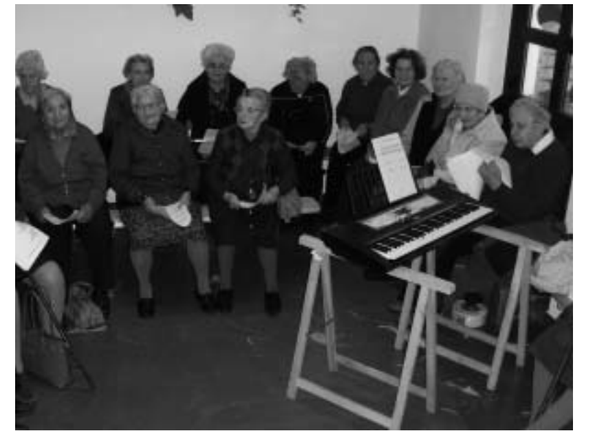
Festa delle castagne a Peonis

Si ringraziano vivamente tutti i partecipanti: gli anziani, innanzitutto, che con il loro entusiasmo e la "voglia di esserci" hanno