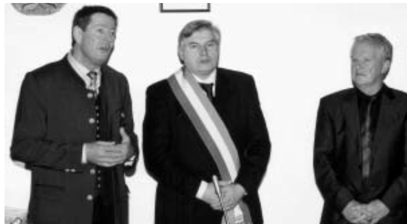
L'intervento dei sindaci

Alle 10.30 si è avuta dunque la celebrazione della Santa Messa