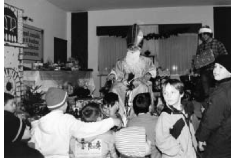
San Nicolò ad Avasinis

C ome di consueto anche quest'anno le mamme di Avasinis, in collaborazione con la Parrocchia e la Pro Loco "Amici di Avasinis", hanno organizzato la festa di San Nicolò per i