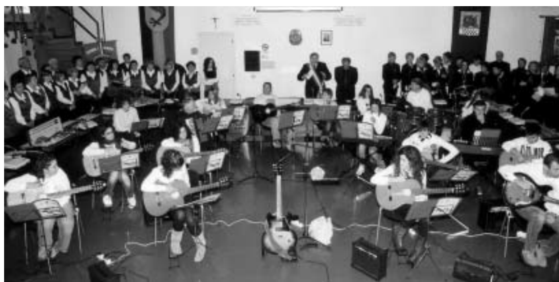
L'esibizione musicale nel gemellaggio con Griffen