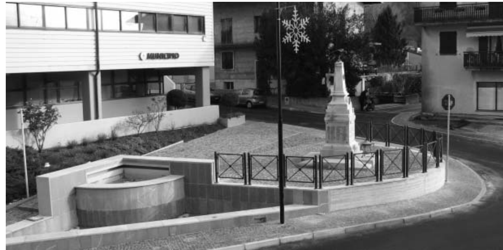
Il nuovo aspetto di piazza Unità d'Italia a Trasaghis