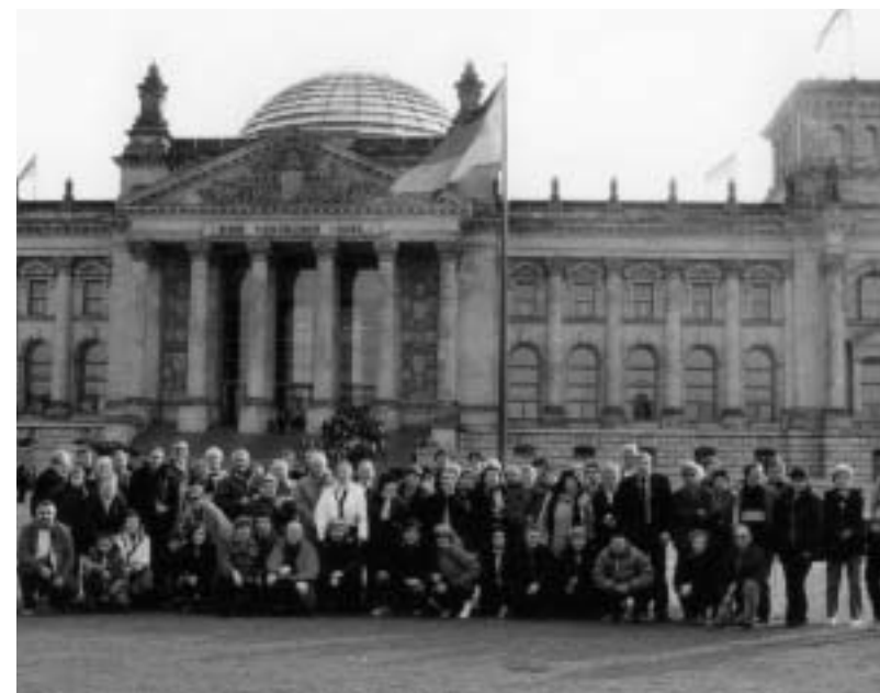
Davanti a Bundestag a Berlino

L'occasione ha consentito anche di visitare la città di Berlino, capitale della nuova Germania riunificata.